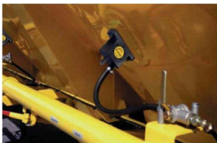
Descarga de silos