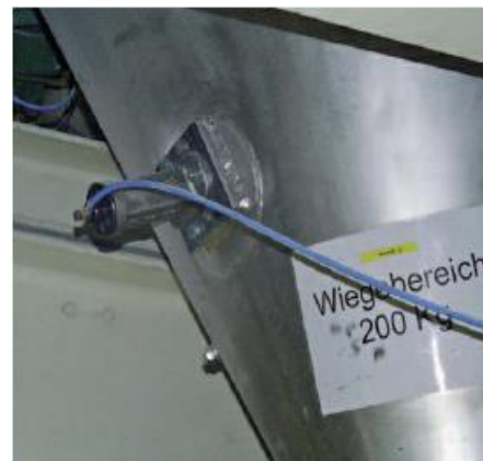
Balanças e moegas com materiais finos e coesivos são totalmente removidos com o uso do impactor PKL