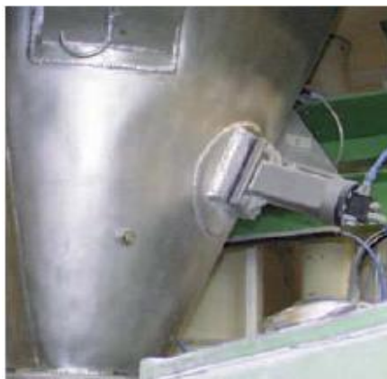
Silos e moegas com extração por meio de válvulas rotativas ou roscas são 100% drenados com os batedores PKL