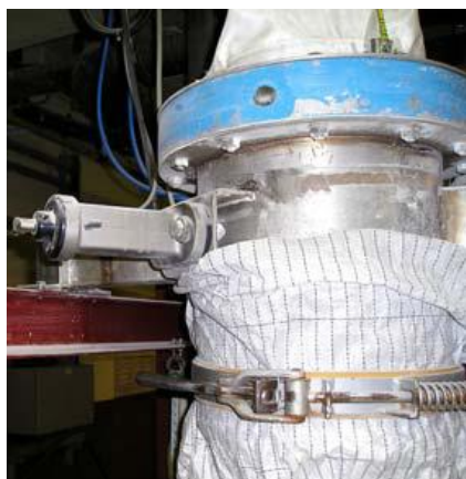
Limpeza de superfícies metálicas

Assim que o ar comprimido aciona os geradores de vácuo, as ventosas fixam o impactador firmemente contra as paredes dos equipamentos.